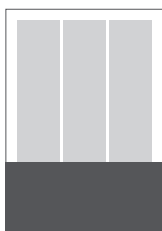
1/3 A4 strana na šírku 210 x 95 mm + 3 mm spadávka (odsadenie orezových značiek od spadávky 3 mm)