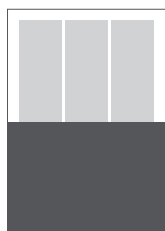
1/2 A4 strana na šírku 210 x 147 mm + 3 mm spadávka (odsadenie orezových značiek od spadávky 3 mm)