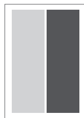
1/2 A4 strana na výšku 84,5 x 267 mm zrkadlo